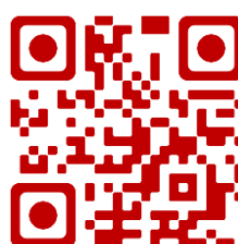
Gépészkar Hallgatói Képviselőlet